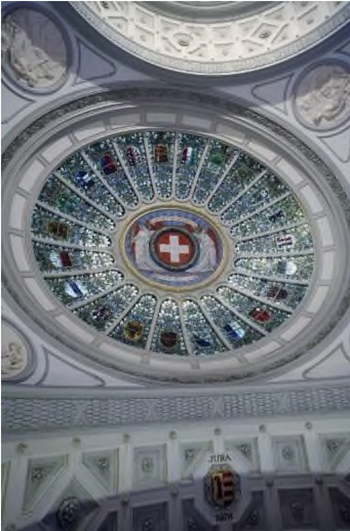
Die Bundeshauskuppel mit den 26 Schweizer Kantonen

Im Unterschied zu den meisten ausländischen Parlamenten ist die Bundesversammlung kein Berufsparlament. Die Bundesversammlung wird deshalb als Milizparlament bezeichnet.