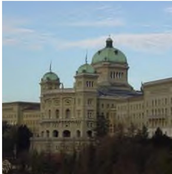
Bundeshaus in Bern

Das politische System zeichnet sich durch hohe Stabilität aus. Auf Bundesebene sind alle grossen Parteien bei der Zusammensetzung der Regierung mit eingebunden.