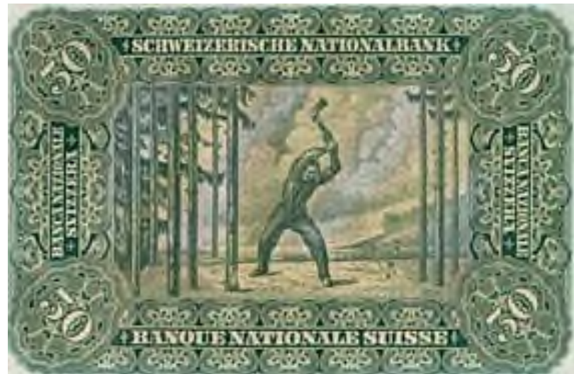
Reproduktion des berühmten "Holzfällers" (Gemälde von Ferdinand Hodler) auf der Rückseite einer 50-Franken-Banknote 1911.