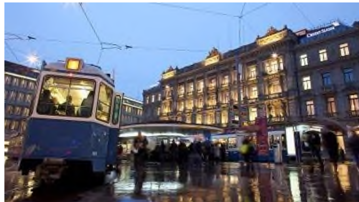
Der Paradeplatz in Zürich – symbolisches Zentrum des Finanzplatzes Schweiz. Hier befinden sich die renommiertesten Bankinstitute der Schweiz.