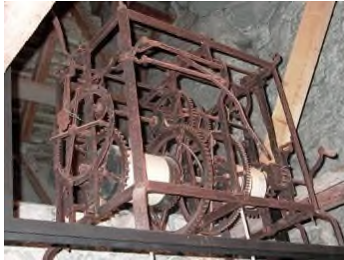
Uhrwerk von 1897 im Schloss Chillon. Die ursprüngliche Uhr stammt aus dem Jahr 1543.