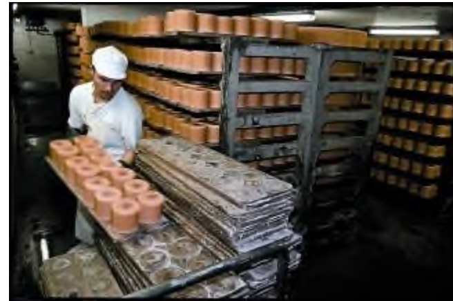
Käseherstellung in der Schweiz

*AOC = Appellation d'origine contrôlée, französisch für „kontrollierte Herkunftsbezeichnung“, ein Schutzsiegel für bestimmte landwirtschaftliche Erzeugnisse