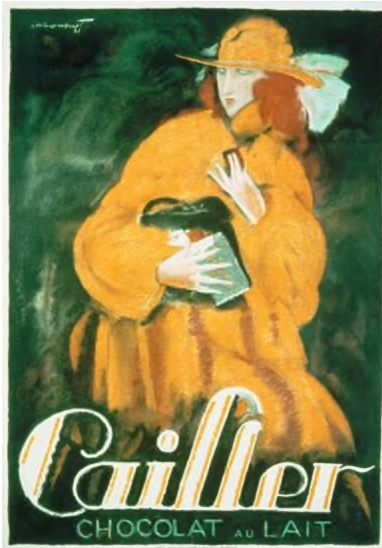
Bildlegenden/Quellen am Schluss der Präsentation