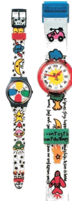
Zwei Modelle aus der Swatch-Kollektion