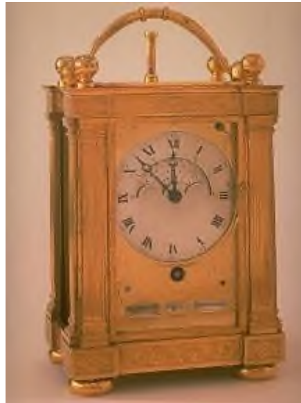
Reiseuhr von Breguet, die an Napoleon verkauft wurde. Nebst einem Kalender sind auch die Mondphasen ersichtlich.