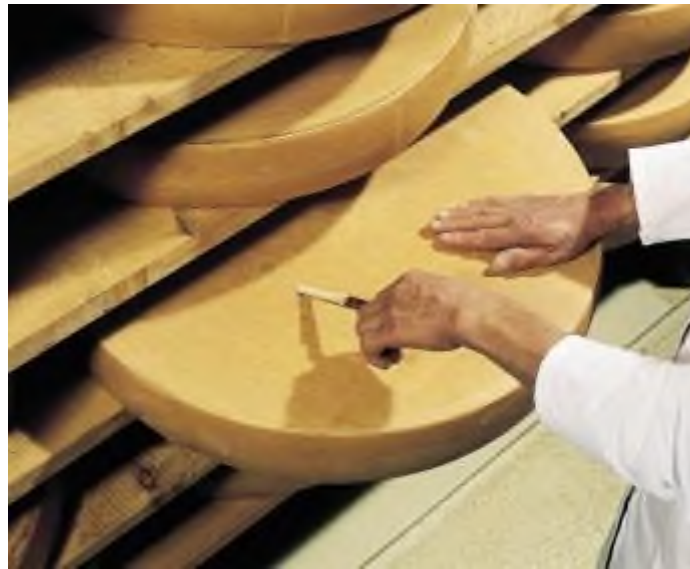
Schweizer Gruyère