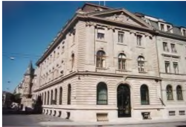
Die Schweizer Nationalbank in Bern