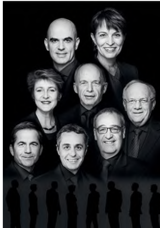
Der Schweizer Bundesrat 2017

Die Regierung der Schweiz besteht aus den sieben Mitgliedern des Bundesrats, die von der Vereinigten Bundesversammlung für eine vierjährige Amtsdauer gewählt sind. Die Bundespräsidentin oder der Bundespräsident ist nur für ein Jahr gewählt.