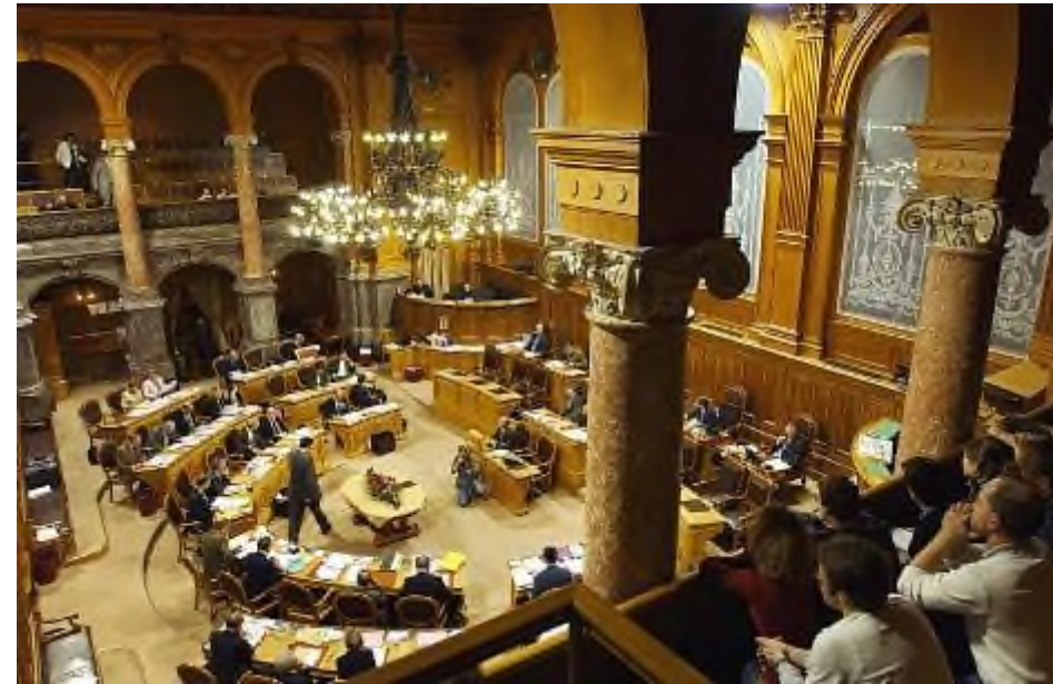
Ständeratssaal während einer Session

Zürich mit über 1 Million Einwohnern wählt ebenso zwei Personen wie der Kanton Uri, der rund 35'000 Einwohner zählt.