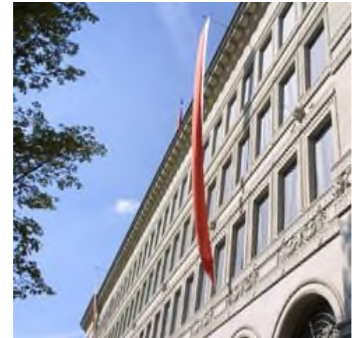
Schweizerische Nationalbank; Sitz des Verwaltungsrats in Zürich