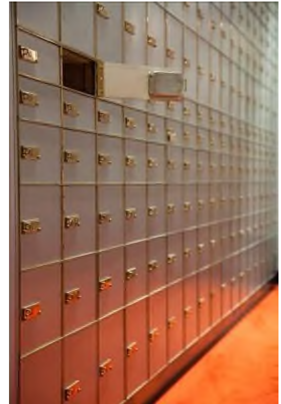
Schliessfächer in einer Schweizer Bank