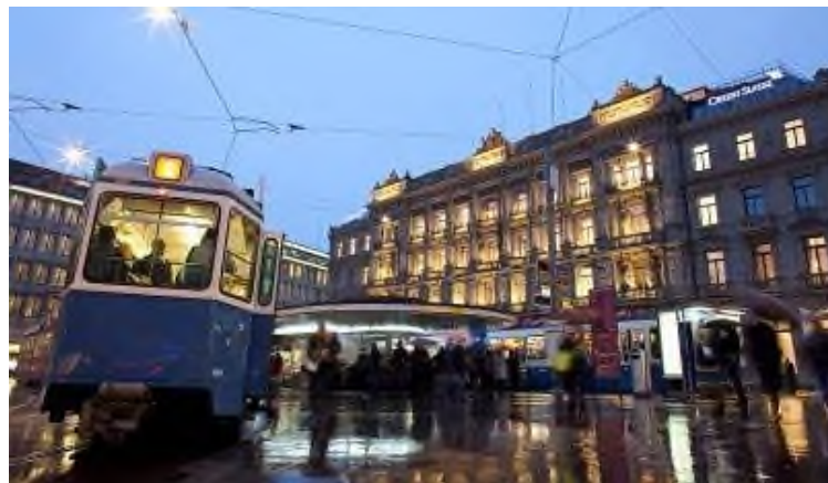
Der Paradeplatz in Zürich – symbolisches Zentrum des Finanzplatzes Schweiz. Hier befinden sich die renommiertesten Bankinstitute der Schweiz.