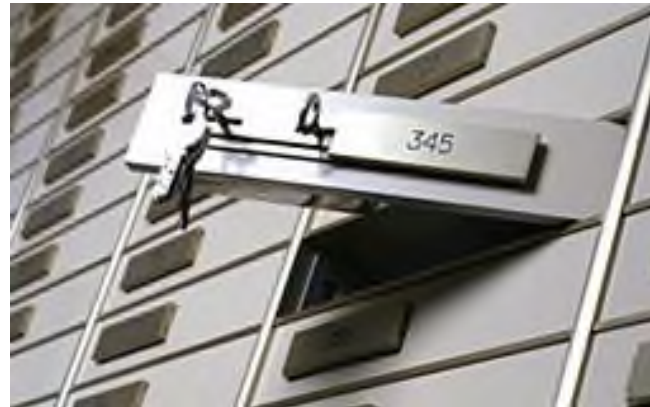
Schliessfächer in einer Schweizer Bank