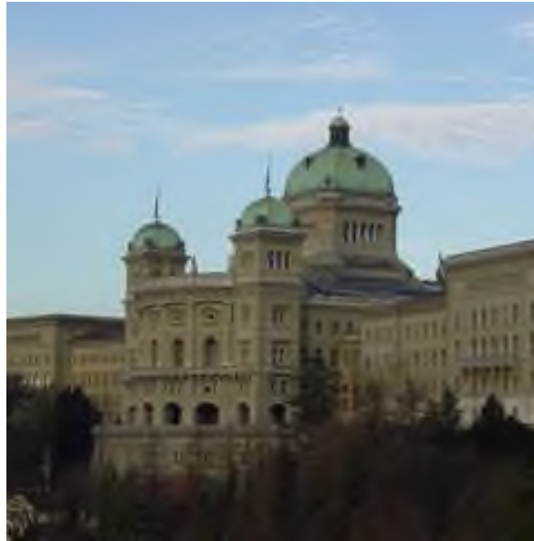
Bundeshaus in Bern

Das politische System zeichnet sich durch hohe Stabilität aus. Auf Bundesebene sind alle grossen Parteien bei der Zusammensetzung der Regierung mit eingebunden.