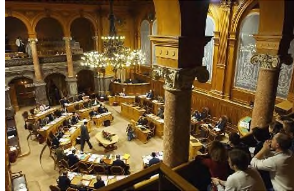
Ständeratssaal während einer Session

Zürich mit über 1 Million Einwohnern wählt ebenso zwei Personen wie der Kanton Uri, der rund 35'000 Einwohner zählt.